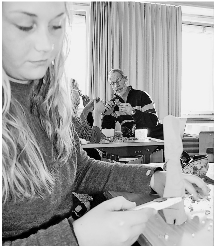
A Christiane esa gratià bain da far la mamma dals Simpsons.

ney» muossa üna munaida da desch dollars cun integrada ün'ura da quarz. Sün üna munaida es sü la Helvetia mo là ingio chi staiva seis nom esa scrit «Kapitalista». Il titel da quist'ouva es «Whore». In venderdi saira muossa e declera Alesch Vital l'intera collezziun. Quella nu's poja dal rest cumprar – per ingüns raps dal muond –, be contemplar d'urant tuot la stagiun i'l Hotel Üja. La rapreschantaziun ha lö in venderdi, ils 30 schner, a las 20.30.