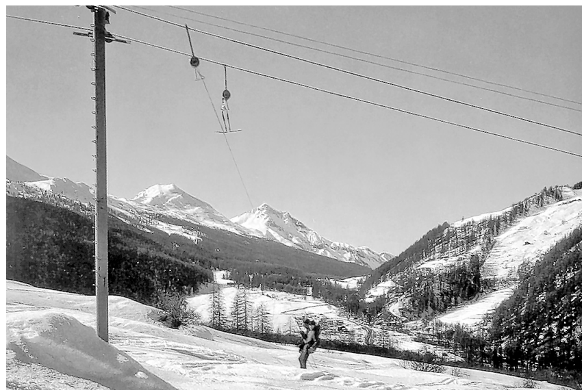
Il runal Quaunas vain quista stà demontà e la società anonima vain scholta.